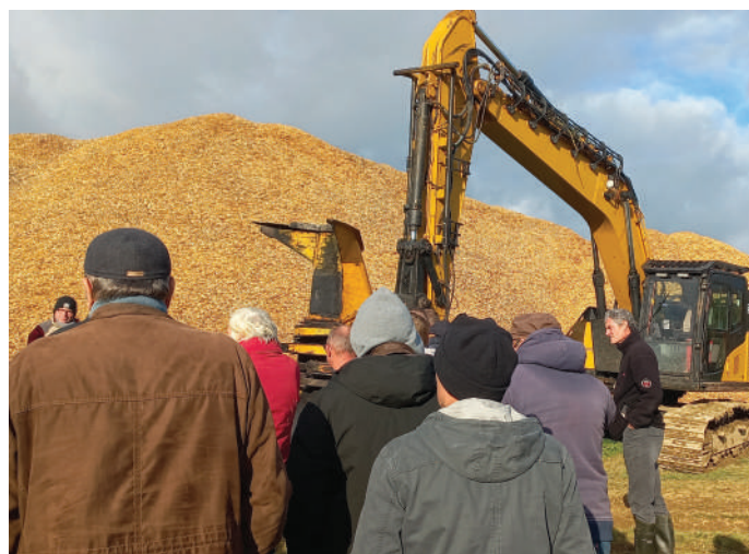
Des adhérents devant la pelleteuse avec tête d'abattage