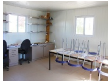
En accès direct sur l'atelier, le nouvel espace de bureau en est cependant isolé.

La cuma de Montaudin a donc mis son site au niveau de ses ambitions