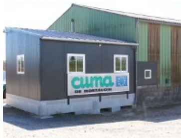
La prestation, et par extension l'emploi, grandit à la cuma de Montaudin. Son site s'adapte avec la construction d'un espace pour le bureau, notamment, pour moins de 40 000 €.

pratique de plus en plus de prestations complètes. Celles-ci, d'une part imposent cette rigueur de l'organisation et sur les enregistrements. D'autre part la coopérative accroît son besoin de main-d'œuvre. Quatre permanents y travaillent aujourd'hui. « Lorsqu'une cuma recherche à recruter, ou à fidéliser ses salariés, ajoute Benoît Bruchet, le directeur de la fdcuma 53, la qualité de ses installations joue en sa faveur . » Celui-ci s'appuie, notamment, sur une récente enquête à propos de la qualité de vie au travail perçue par les salariés de cuma (voir p. 16). « C'est un sujet sur lequel nous travaillons particulièrement avec les employeurs », indique-t-il.